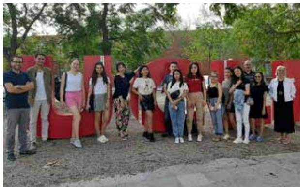
Foto VI.2 Bienvenida estudiantes programa Bolashak en Ciudad Real. Curso 2020-2021