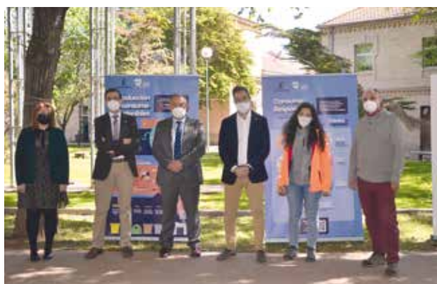
Foto VI.5 Inauguración exposición «Estrategia de Educación Ambiental». Horizonte 2030

Aunque todavía marcado por las restricciones en materia sanitaria, el número de actividades y actos en los que este Vicerrectorado ha participado o colaborado en su celebración durante el curso 2020-2021 con diferentes instituciones locales, provinciales, regionales y nacionales ha sido importante. De entre ellos, se destacan los siguientes: