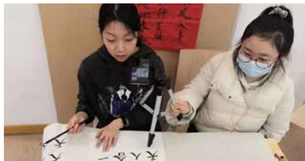
Fotos VI.2 y 3 Actividades Instituto Confucio 2021: Ceremonia Concurso Puente a China y Taller de caligrafía online