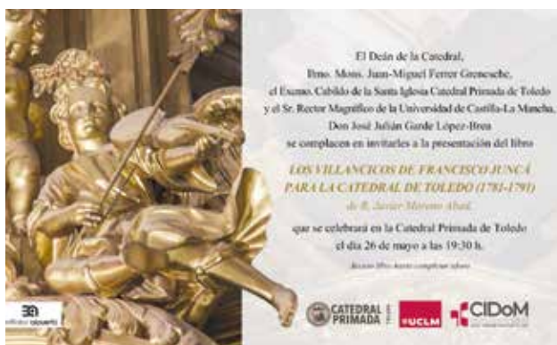
Foto VI.6 Presentación del libro «Los Villancicos de Francisco Juncá para la Catedral de Toledo»