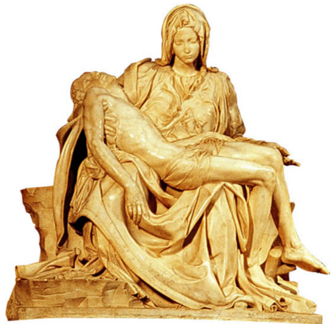
Fig.2 Puntuación máxima. 2 puntos