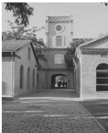
Edificio del Reloj