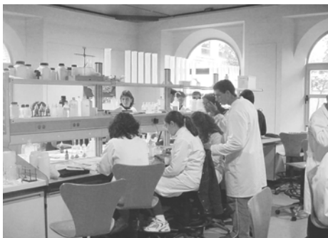
Laboratorios de docencia